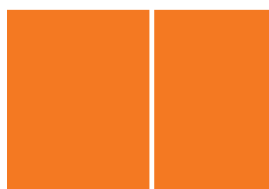
1 strona + dwustronne skrzy- dełko maxi na spad* 230x300 mm + 219x300 mm 10 000 PLN

* należy doliczyć po 5 mm z każdej strony na spad