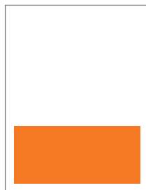
1/3 strony 197x83 mm 2 700 PLN